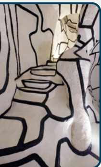
Jean Dubuffet, la Tour aux figures, ©ADAGP CD92/WILLY LABRE