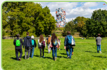
©Jean Dubuffet, la Tour aux figures, ©ADAGP CD92/STEPHANIE GUTIERREZ-ORTEGA

Toutes les infos : www.hauts-de-seine.fr/le-parc-de-lile-saint-germain